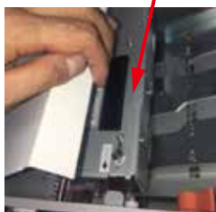
天板を開いて給紙ユニットのツメを確認