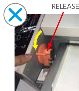
給紙セットレバーがセットの位置に 上がっていないと給紙されません