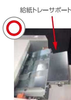
給紙トレーサポートを取り付けていないと 給紙レバーがセット位置に固定されず 給紙されません