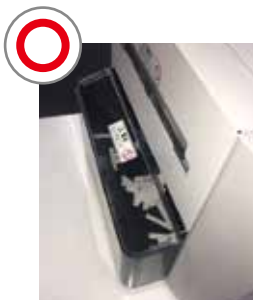
余白箱が少しでも空いていると [E004] エラーが出てスタートしません